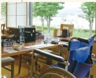
車椅子でも対応できるテーブルを設置