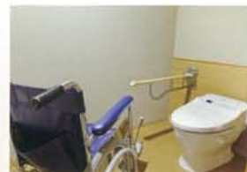
広々としたトイレには手すりも完備