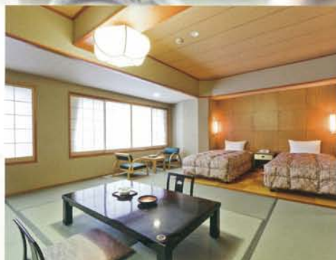
ベッドも完備した専用居室

広々としたお部屋はもちろんバリアフリー。ベッドも使いやすいゆったりタイプです。洗面所やトイレには、車椅子で楽に移動できるスペースがあります。