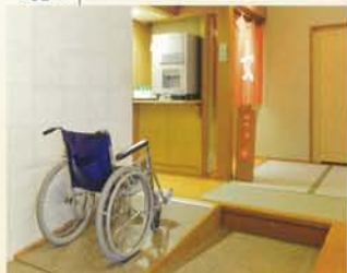
大浴場のいたるところにスロープがあります

脱衣所から大浴場へ通路はスロープになっており、車椅子でも安心して移動できます。洗い場には少し高めの椅子をご用意。