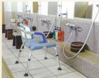
高めの椅子を準備