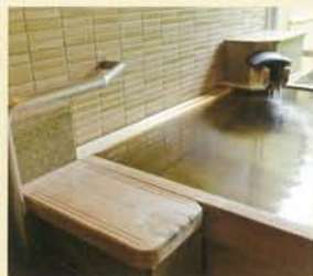
手すりも椅子も設置されています

湯船の横には腰掛けて入れるように椅子が設置されています。ゆったりと心ゆくまでお寛ぎください。