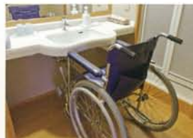
車椅子でもらくらく利用できる洗面所