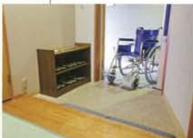
段差のない出入口