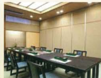
和室椅子テーブルの個室