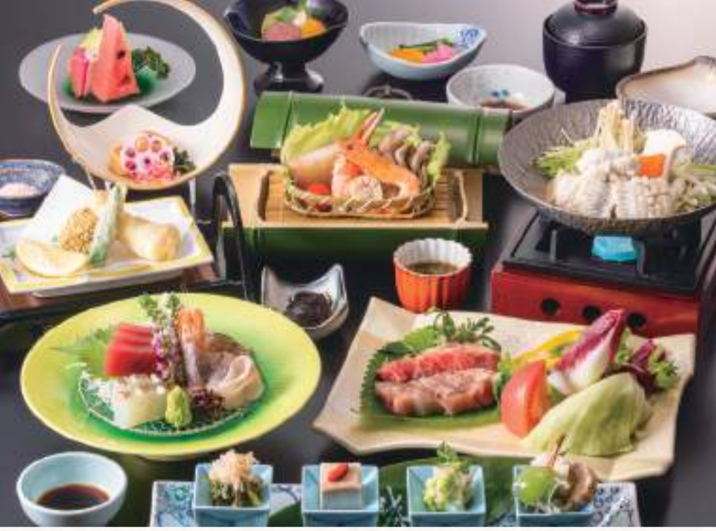
写真は「舌鼓コース」の一例です。

ご夕食は、地元信州の食材満載の 当館オリジナル会席「朱白膳」を基本に 多彩な会席コースをお楽しみいただけます。